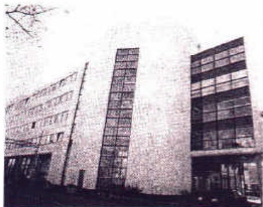
Een RGD-15 kantoor. Bedrijfskantoor Heineken Zoeterwoude.

/// 'We hebben besloten op zoek te gaan naar een nieuw pand. Want onze organisatie groeit danig uit zijn jas. Er moet in ieder geval topkoeling in, want we willen geen gezeur meer hebben over die temperatuur in de zomer.' Makelaar: 'Topkoeling? Geven jullie dan zoveel warmte af?' Huurder: 'Nee, dat niet. We hebben gewone kantoorfuncties, maar wel met ieder een eigen beeldscherm en nogal wat printers.' Makelaar: 'Dus misschien zou u aan een RGD-20 kantoor voldoende hebben.' Huurder: 'Ook zonder topkoeling?' Makelaar peinzend: 'Als het maar een RGD-20 kantoor is. Toevallig hebben we twee RGD-20 gebouwen in de portefeuille op prima lokaties. De één ligt mooi in het zicht vanaf de A 58. Om hoeveel vierkante meter gaat het eigenlijk?'