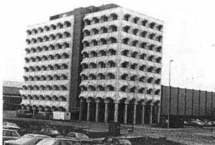
Een RGD-30 à 40 kantoor. Gebouw 404 te Schiphol.